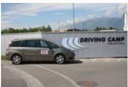
Citroen C4 Grand Picasso